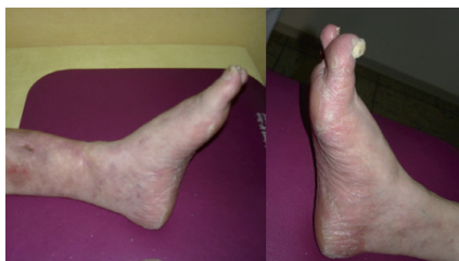
Abb. 4 (links): Nach der zweiten Behandlung sieht man deutliche Heilungstendenzen am Ulcus cruris. Der Schmerz war völlig verschwunden, und die Hyperkeratose bildete sich weiter zurück, sowohl am (a) linken als auch am (b) rechten Fuß.