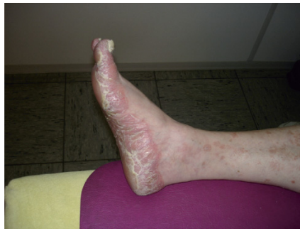
Abb. 2 (links): Dieses Foto entstand nach der ersten Behandlung, als sich der Zustand schon sichtbar verändert hatte. Das generalisierte Ekzem war schon völlig verschwunden. Der Schmerz war kaum noch spürbar, und die Hyperkeratose an der Fußsohle war in ihrer Stärke halbiert. Leider existiert kein Foto von der Ausgangssituation.